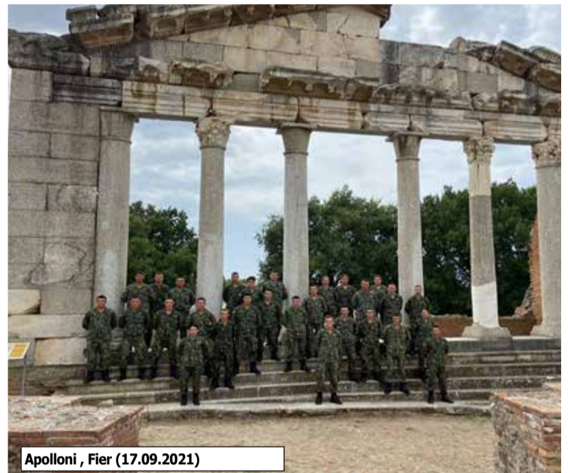
Apolloni, Fier (17.09.2021)

ishin të përfshirë një sërë aktivitete, bazuar në mendimet dhe eksperiencat e stafit të DFU."