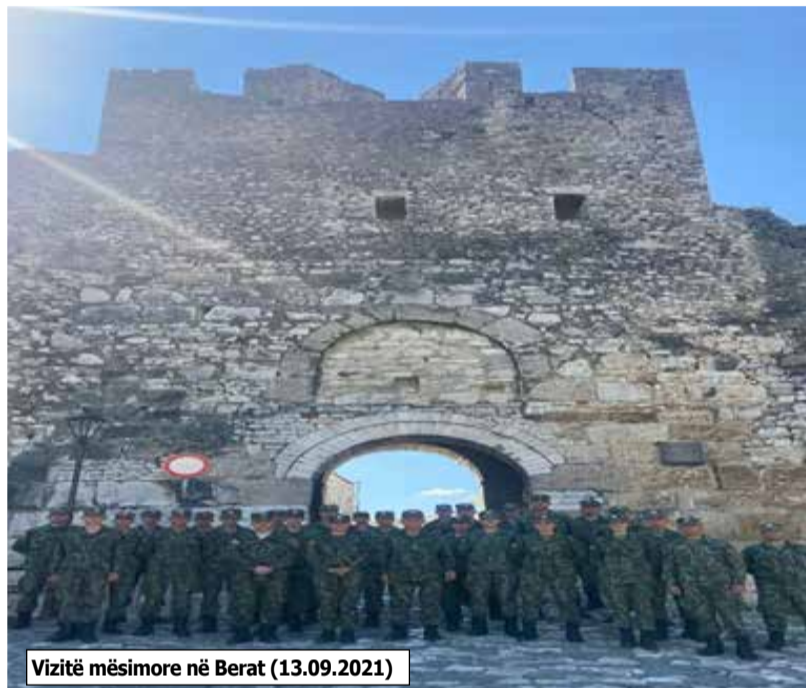
Vizitë mësimore në Berat (13.09.2021)