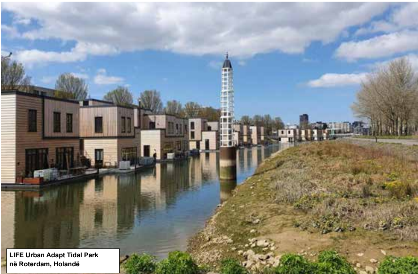
LIFE Urban Adapt Tidal Park në Rotterdam, Holandë

Ndërkohë, në jugperëndim të Holandës, projekti "LIFE Dutch Dune Revival" ka restauruar rreth 190 hektarë duna me mbështetjen e financimit të BE-së. Si rezultat, njerëzit që jetojnë në zonë tani mund të mbështeten në një mbrojtje natyrore kundër rrezikut të përmbytjeve bregdetare të përkeqësuar nga rritja e nivelit të detit.