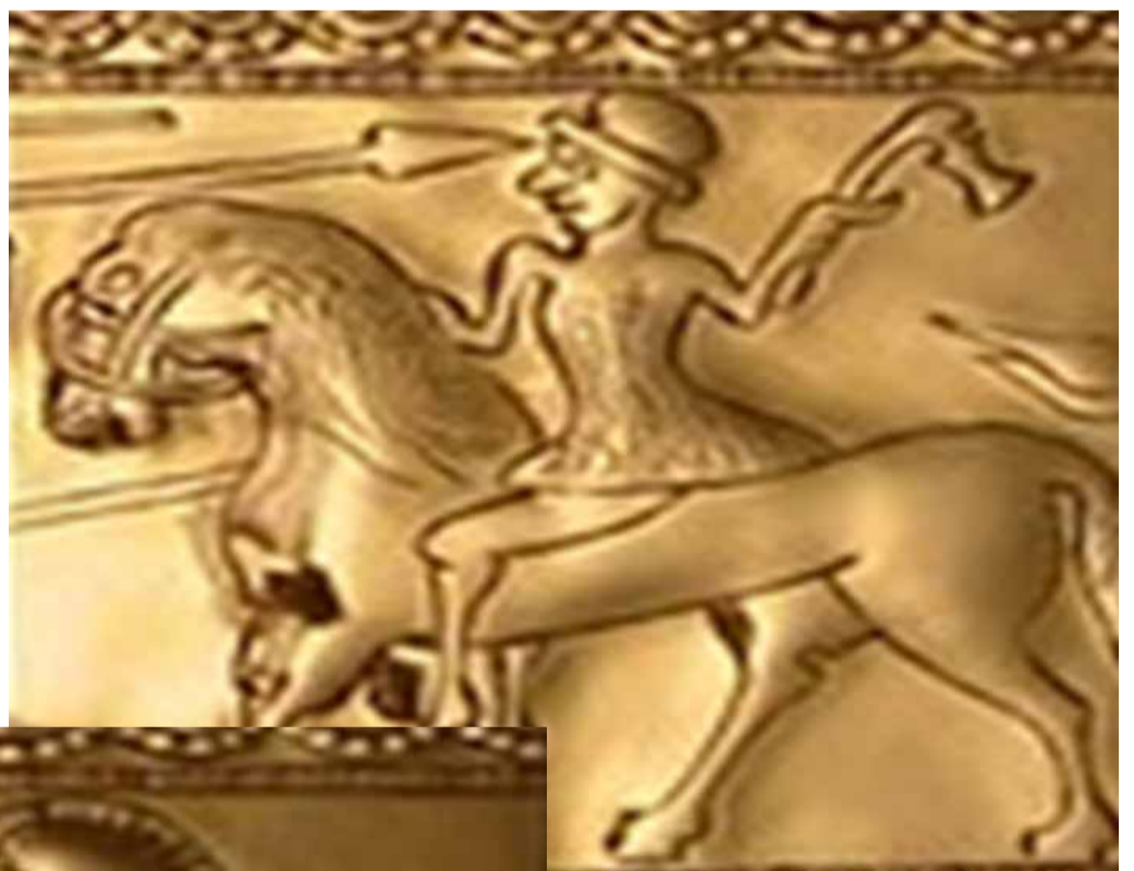
Galeria e artit ilir

Në vitet e pushtimit romak prej artit zyrtar shkëputet arti i trevave fshatare, ku pasqyrohen motive nga jeta e përditshme. Me praninë e elementëve të thjeshtë artistikë, që dallojnë nga veprat e mëparshme, si dhe me skalitjen e veshjeve dhe emrave ilire, veprimtaria e këtyre viteve mund të vlerësohet edhe si një qëndresë ndaj asimilimit prej pushtuesve më të fuqishëm të kohës.