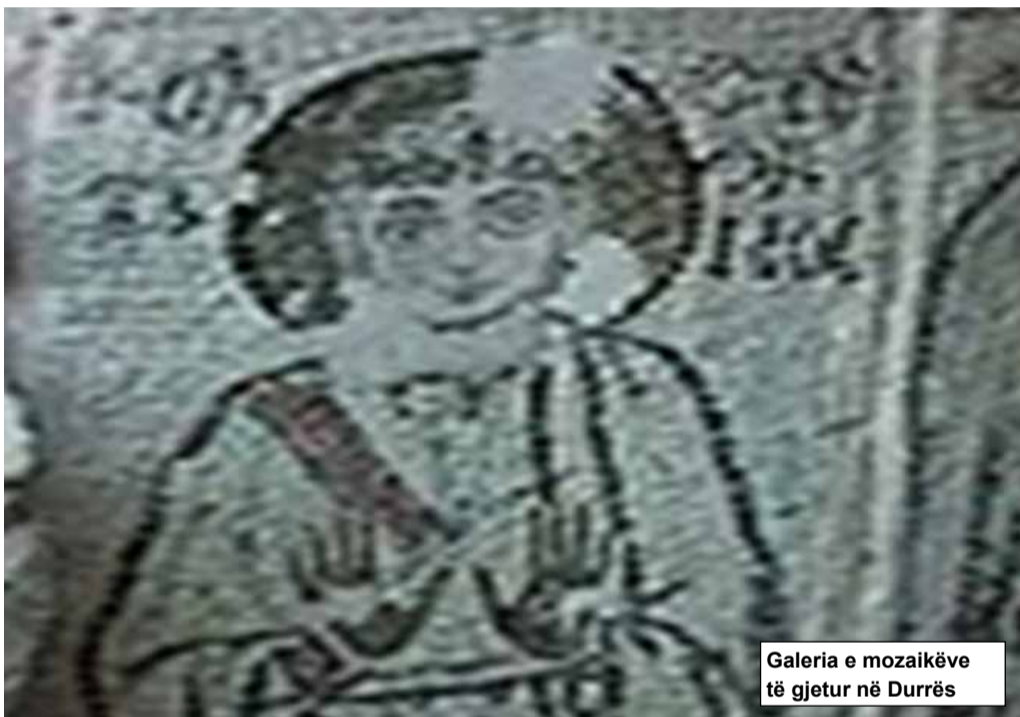
Galeria e mozaikëve të gjetur në Durrës