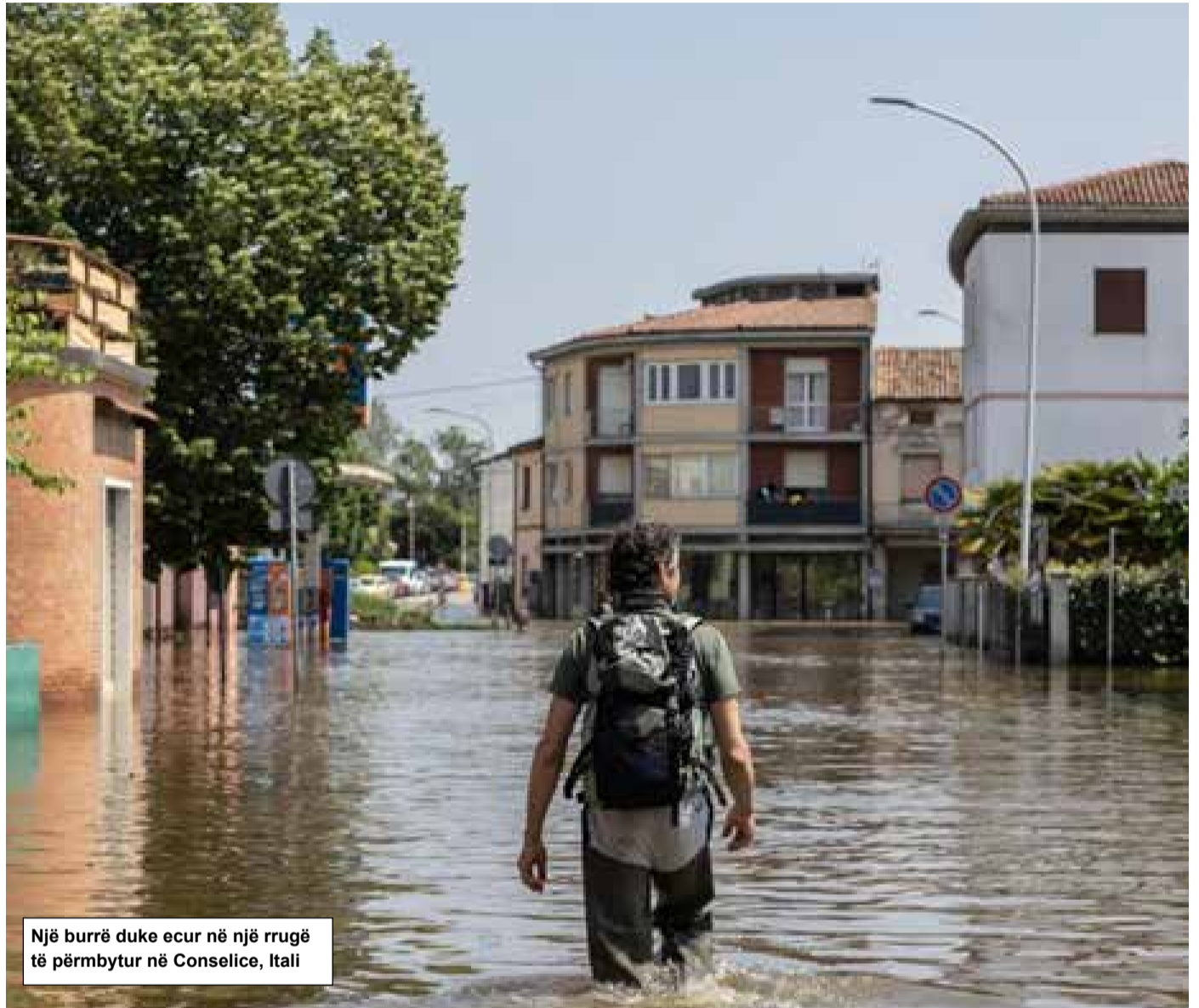
Një burrë duke ecur në një rrugë të përmbytur në Conselice, Itali

Në Milano (Itali), projekti "LIFE Metro Adapt", fitues i çmimit "LIFE Climate Award 2023", u dha planifikuesve urbanë lokalë udhëzime për të aplikuar zgjidhje natyrore për të parandaluar përmbytjet dhe implikimet e tyre shëndetësore. Udhëzimet u zbatuan shpejt, për shembull, një parkim publik makinash u pajis me një sistem të qëndrueshëm kullimi dhe një rrjet kanalesh u rivendos për të rritur kapacitetin e mbajtjes së ujit.