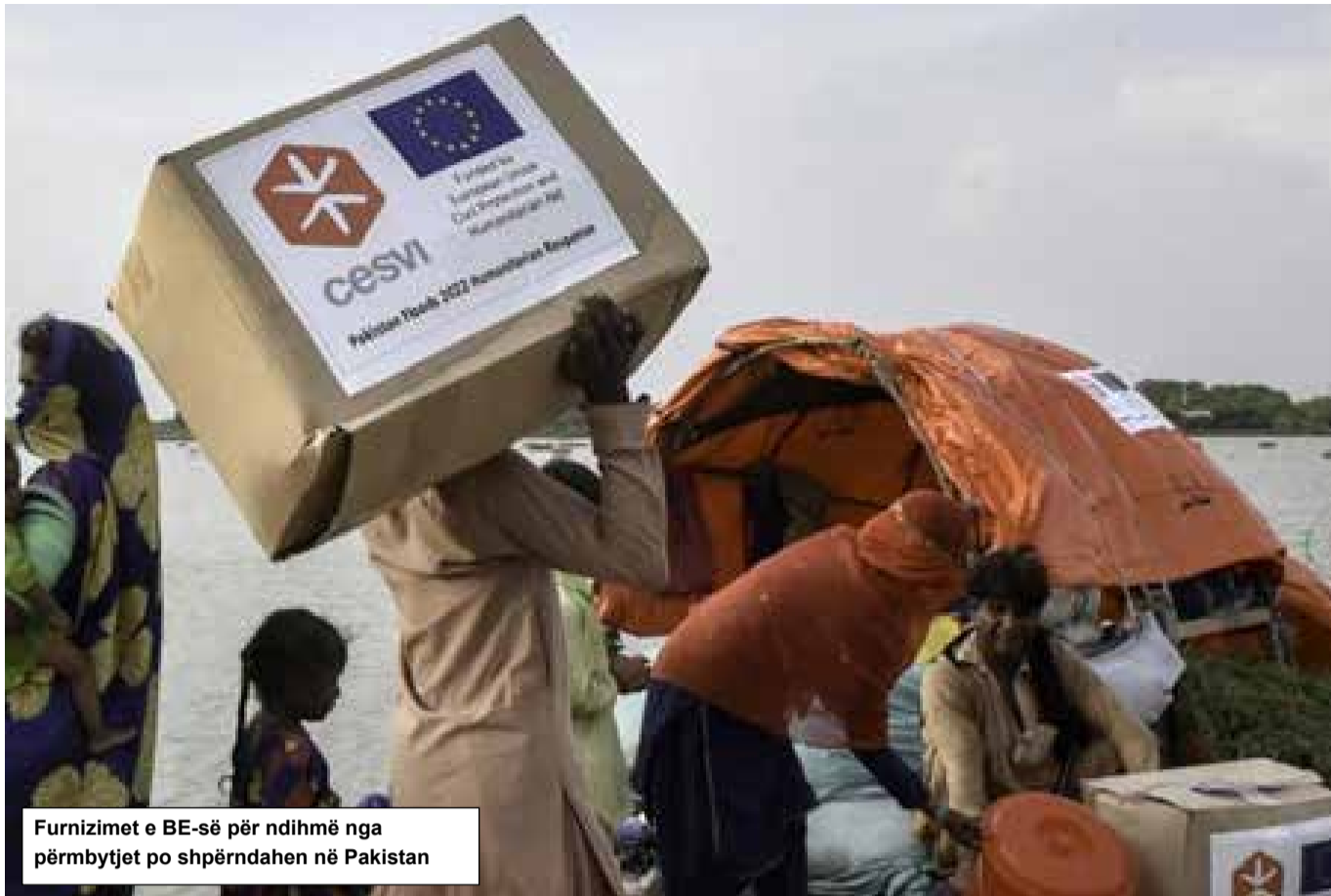
Furnizimet e BE-së për ndihmë nga përmbytjet po shpërndahen në Pakistan

“Projekti LIFE NAdapta” po mbron shëndetin e njerëzve në të gjithë Navarrën (Spanjë), duke përmirësuar sistemet lokale të menaxhimit të ujit. Së pari, rreziku i përmbytjeve po zvogëlohet duke rivendosur kufijtë e lumenjve të dëmtuar, duke krijuar mekanizma