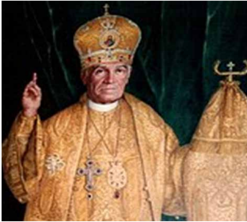
Peshkop Noli në Kishën Worcester, afër Bostonit në Massachussets, SHBA