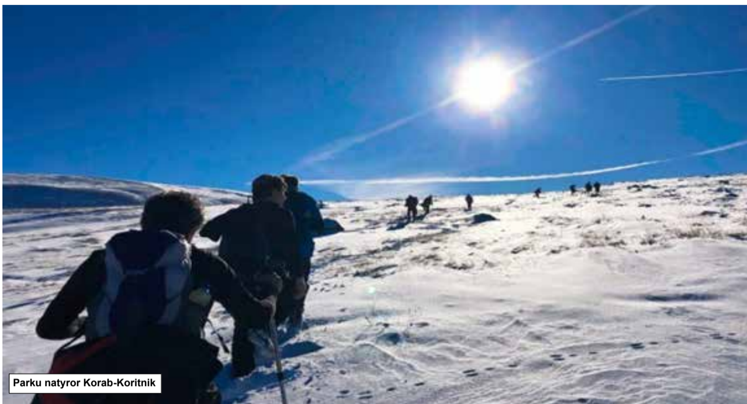
Parku natyror Korab-Koritnik

Fshati i Rehovës është i njohur në të gjithë vendin për artizanatin, mikpritjen, gatimet e veçanta, bukuritë dhe trashëgiminë e pasur, të ruajtur deri në ditët e sotme. Rehova piktoreske, e cila shtrihet në rrëze të malit të Gramozit, është për zgjedhur në 100 fshatrat model dhe do krijojë të njëjtin itinerar si Voskopoja, duke i dhënë këtij fshati një zhvillim të ri turistik e ekonomik, përmes rijetëzimit të vlerave që mbart si për turistët vendas, ashtu dhe për turistët e huaj.