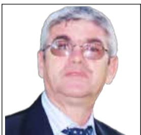
Përgatitur dhe përshtatur nga SAKIP CAMI