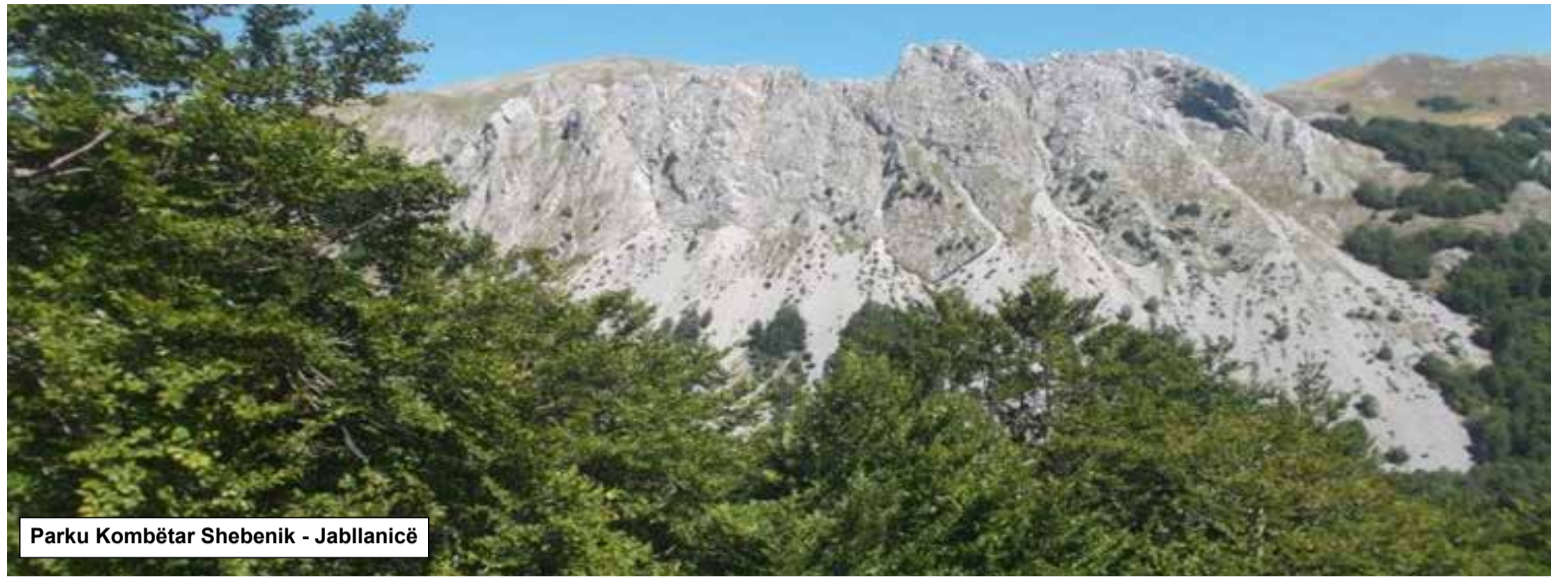
Parku Kombëtar Shebenik - Jabllanicë

Nuk duhet t'i mungojë listës së destinacioneve pushuese, fshati Nivica, në afërsi të Tepelenës. I pasur jo vetëm me bukuri natyrore, por edhe me