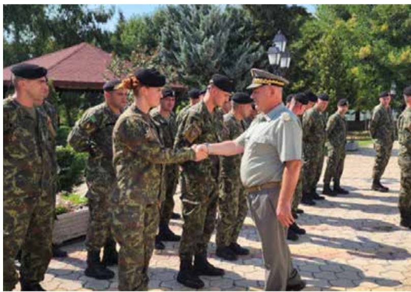
Kompanisë së Dytë të Batalionit të Dytë të Këmbëorisë, pasi realizoi detyrën për një periudhë 6 - mujore në kuadër të misionit të NATO-s, i dorëzoi autoritetin Kompanisë së Tretë të Batalionit të Dytë të Këmbëorisë.