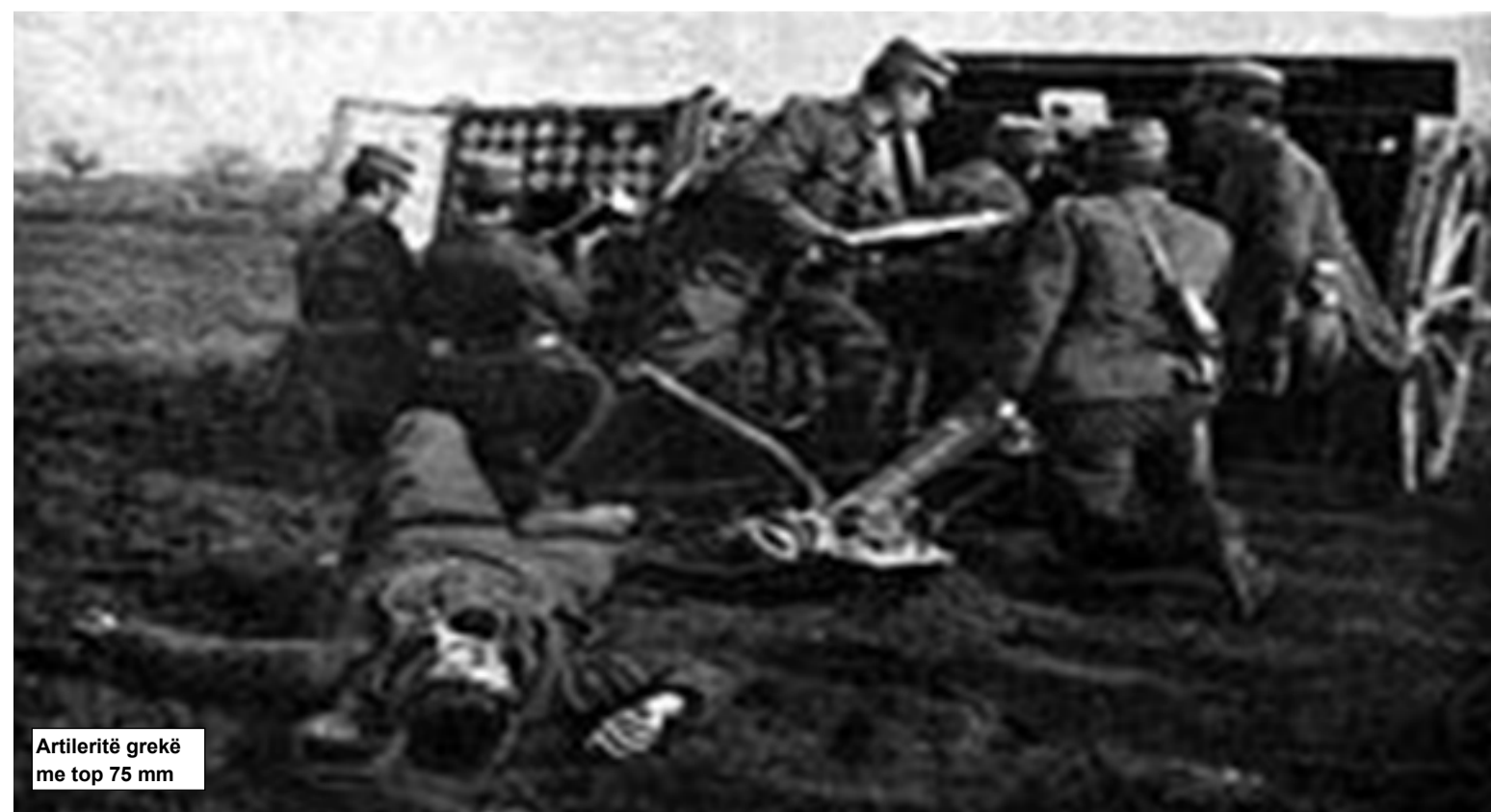
Artileritë grekë me top 75 mm

“ USHTRITË E KOMBINUARA TË SHTETEVE BALLKANIKE MPOSHTËN USHTRITË OSMANE FILLIMISHT NUMERIKISHT INFERIORE (SUPERIORE NË FUND TË KONFLIKTIT) DHE STRATEGJIKISHT TË PAFAVORIZUARA, DUKE ARRITUR SUKSES TË SHPEJTË.