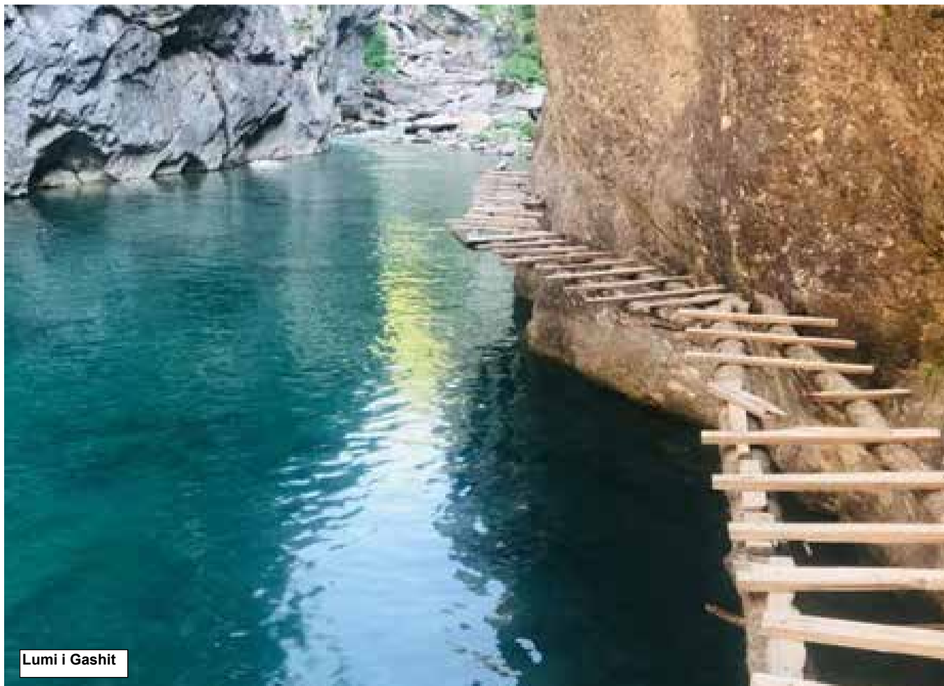
Lumi i Gashit

Llojet kryesore të kafshëve që gjenden në këtë zonë të rrallë natyrore janë, ariu i murrme ( Arsus arctos ), dhia e egër ( Rupicapra rupicapra ), kaprolli ( Capreolus capreolus ), macja e egër ( Felis silvestris ), ujku ( Canis lupus ), derri i egër, lepuri, dhelpra. Kurse shpendë, mund të përmendim: gjeli i egër ( Tetra urogallus ), shqipja e Ballkanit ( Circus pygargus ), shkaba ( Gyps fulvus ), thëllëza e malit, ( Alectoris graeca ) etj.