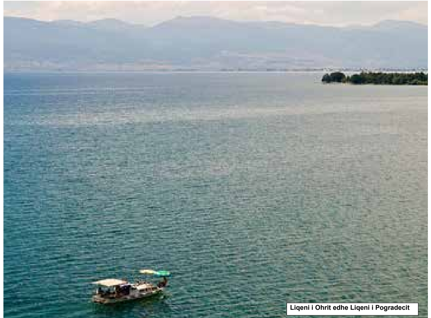
Liqeni i Ohrit edhe Liqeni i Pogradecit

Liqeni i Ohrit është shtëpia e shumë kafshëve endemike, të cilat vijnë vetëm në ujërat e tij. Në liqen rriten 40 specie të rralla, ndër më të njohurat dhe ekonomiksht më të rëndësishmet është peshku i pastër i llojit Salmo letnica (korani), " Salmothimus ohridanus " (belushka).