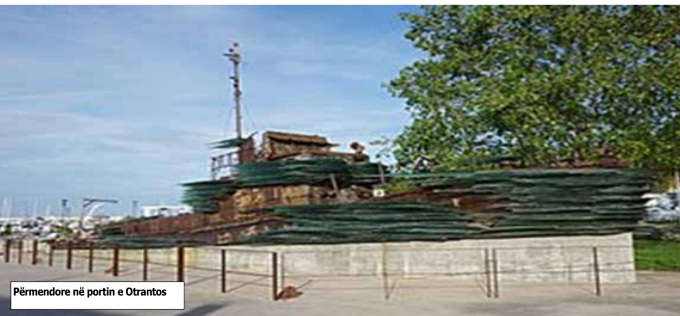
Përmendore në portin e Otrantos

Tragjedia shumë shpejt u bë pjesë e këngëve popullore shqiptare, të cilat u dedikoheshin rapsoditë e emigrantëve shqiptarë para luftës së dytë botërore. Ato kishin metafora dhe performanca popullore me vajtime dedikuar tragjedisë së Otrantos. Pjesë të katerit të radës janë transportuar në hyrje të portit të Otrantos si monument për tragjedinë. Ky projekt u realizua nga skulptori grek Costas Varotsos. Më parë anija ishte lënë e braktisur në brigjet e Otrantos.