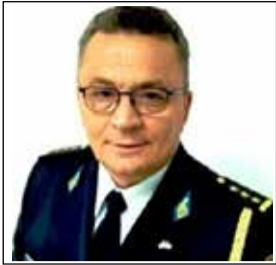
KOLONEL HYSNI GJERGJI