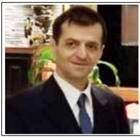
KAPITEN (P) VERI TALUSHLLARI