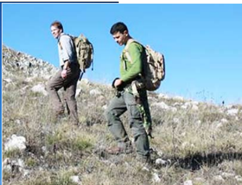
Në kërkim të avionit të rrëzuar 70 vjet më parë

kërkimin. Bëhej fjalë për një listë të plotë të avionëve britanikë të rënë në Luftën e Dytë Botërore publikuar nga Muzeu i Harringtonit. Në faqen 417 të dokumentit, një Halifax (Mk IIP244) i Skuadronit 148 jepet si i zhdukur, pa koordinata dhe pa ngjarje, ndërsa ishte nisur në mision furnizimi për Operacionet Speciale në Shqipëri, me datë 20 tetor 1944. Nuk ka të dhëna të tjera përveç faktit se memorialet me emrat e ekuipazhit janë në Maltë. Natyrisht të pakonfirmuar si të rënë në Shqipëri. Dhe konkretisht: