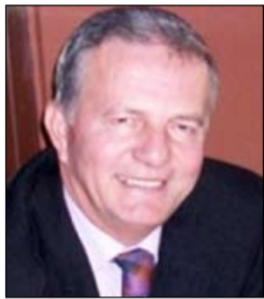
NGA VIRON KONA, SHKRIMTAR

Vitet ikin, gjithë bujë e zhurmë, Plot brengë, dashuri, vuajtje dhe mall, Vendin e tyre e zënë net pa gjumë, Flokë të thinjura, rrudha në ballë.