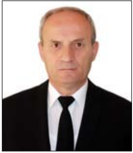
NËN/KOL (R) MSC KANAN HIMAJ Qendra e Doktrinës dhe Kërkimit

T errorizmi, si shfaqje e dhunshme ndaj njerëzimit, shfaqje me peshë të madhe në të gjitha veprimtarinë shtetërore dhe shoqërore, është sot tema e ditës. Në veçanti është kryefjala që lidhet me ngjarjet e ndodhura para pak ditësh në Paris, në simbolin e demokracisë, ku për shkak të errësirës së mendjeve të terroristëve humbën jetën shumë njerëz të pafajshëm, pse ata gëzonin lirinë e tyre.