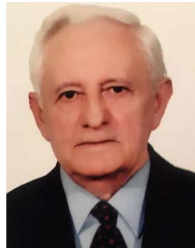
Përkushtim për Organizatën e Veteranëve

Ndërsa vlerësimi më i madh për të ka mbetur mirënjohja dhe respekti që i kanë bërë në këto vite studentët ushtarakë duke e cilësuar "komandant legjendar".