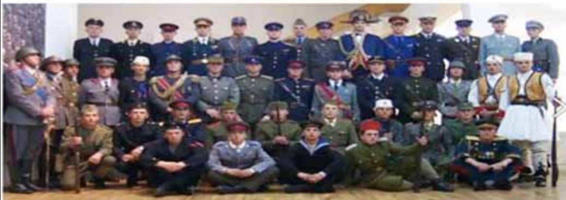
Nga ekspozita e vitit 2002, “Shqiptar në uniformë”. Çelur pranë Galerisë së Arteve në Tiranë