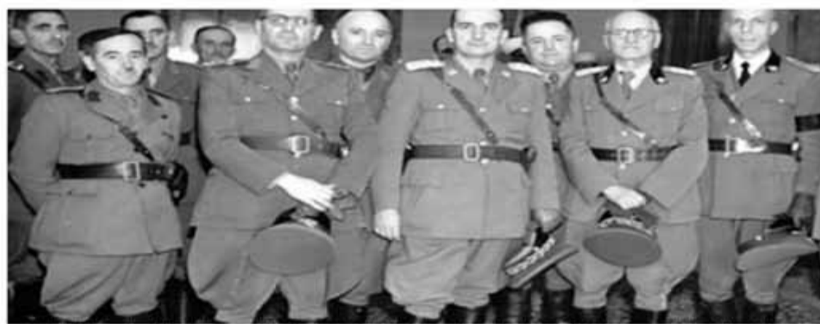
Tefik Mborja dhe hierarkët fashistë shqiptarë në vitin 1941, me veshje të njehta me ato të “kolëgeve” italianë

Por para saj, do të mbizotëronte ajo e Ushtrisë Fashiste, veshje me të cilat do të shiheshin rëndom jo vetëm hierarkët fashistë shqiptarë, por edhe anëtarët e Milicisë. Më 18 shtator 1939, Jakomon nënshkroi dekretin për krijimin e milicisë fashiste, një nga organizmat e parë të Partisë Fashiste Shqiptare. Kjo strukturë bënte pjesë në Milicinë Vullnetare për Sigurimin Kombëtar. Kjo milici “garantonte zhvillimet e revolucionit fashist”, por angazhohej edhe si trupë elitare në kuadër të ushtrisë. Megjithatë në to shihen qartë edhe simbole kombëtare, si plisa apo qeleshe, e madje shkonte edhe më tej, kur shih se anëtarët e “Gardës Mbretërore” (Guardia Reale Albanese) parakolonin në mes të Romës, të veshur tërësisht në kostume kombëtare shqiptare. Më tej, ndërsa oficerët do t’i riktheheshin uniformave të monarkisë (duke u hequr sidoqoftë simbolin e Zogut) ushtarët e Ushtrisë Kombëtare të ringritur gjatë kohës së Regjencës gjatë periudhës së pushtimit gjerman, pas kapitullimit të Italisë, do të vijonin t’i mbanin në pjesën më të madhe për nevojat utilitare uniformat e ushtrisë italiane, tashmë me emblemën e “shtetit të ripavarësuar” shqiptar.