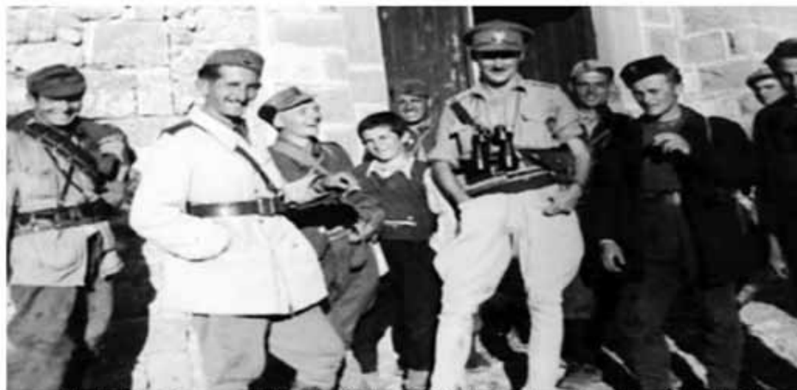
Anëtarë të misioneve britanike në vitet 1943-44 dhe krerë nacionalistë shqiptarë