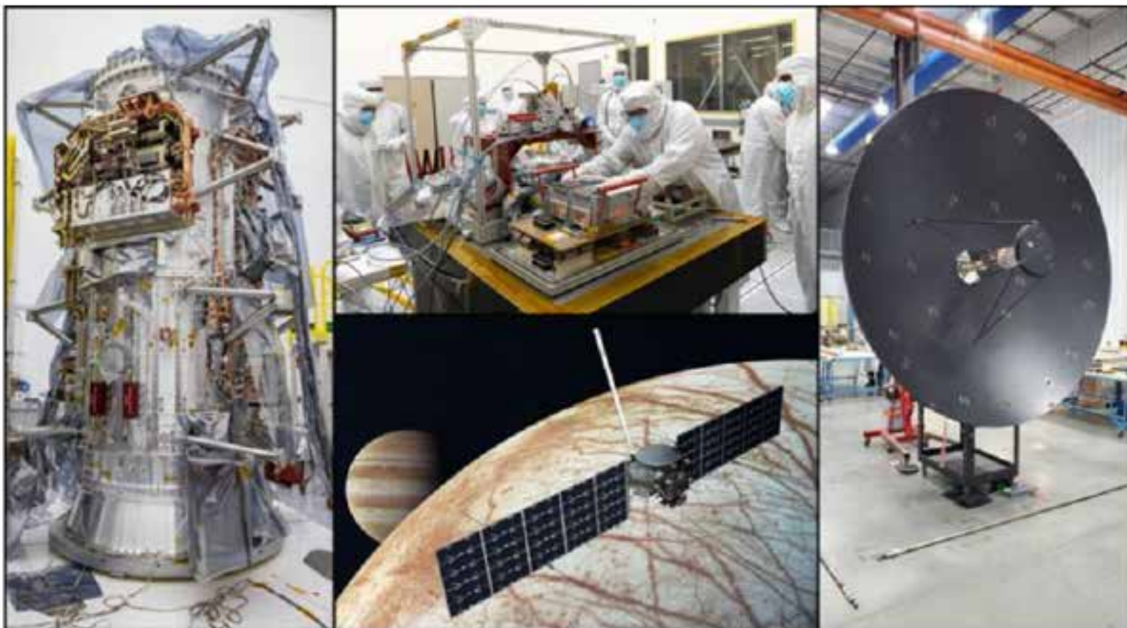
Disa imazhe nga montimi i "Europa Clipper".

Europa është më e vogla nga katër hënët e planetit të Jupiterit, por është vetëm pak më e vogël se Hëna e Tokës. Sipërfaqja e saj e ndritshme (afërsisht pesë herë më reflektuese se Hëna), brezat e thithjes së akullit të ujit me rreze infra të kuqe dhe mungesa e afërt e kraterëve të ndikimit (vetëm rreth pesë janë identifikuar deri më sot) tregojnë se sipërfaqja është e pasur me akull dhe shumë e re, ndoshta vetëm 30 milionë vjet të vjetra. Europa është e mbuluar nga një guaskë uji-akulli jo më shumë se 150 kilometra e trashë. Llogaritjet sugjerojnë se mund të ketë ujë të lëngshëm në bazën e kësaj shtrese të akullit, duke çuar në spekulime se një formë primitive e jetës mund të ketë evoluar në këtë botë të errët dhe ujore. Trashësia e akullit të sipërfaqes dhe prania e mundshme e ujit të lëngshëm kanë intriguar shkencëtarët planetarë që nga fundi i viteve 1970. Europa ishte sateliti më i dobët i vëzhguar nga satelitët e Galileos kur "Voyager" kaloi përmes sistemit të Jupiterit në vitin 1979 dhe shkencëtarët me padurim presin imazhet e para të Galileos të kësaj bote të thyer të akullit.