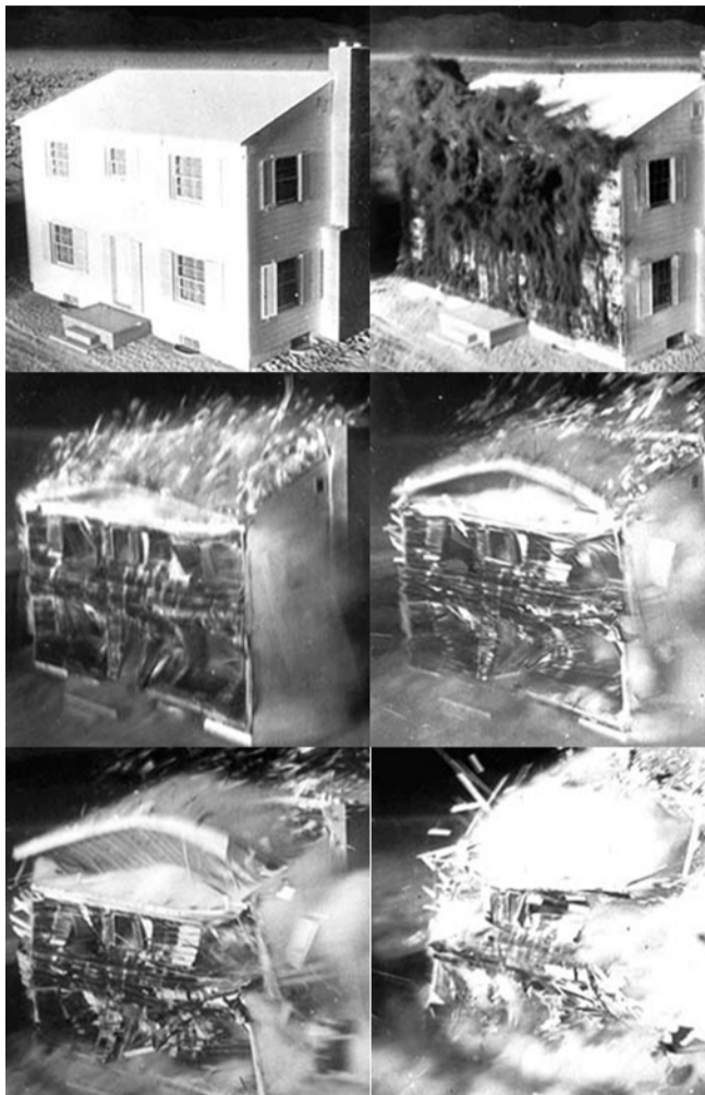
Efektet e valës së shpërthimit në një shtëpi tipike me strukturë druri.

Kjo rritje shoqërohet me një ulje të temperaturës për shkak të rritjes shoqëruese të masës. Në të njëjtën kohë, topi i zjarrit