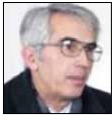
NGA SALI ONUZI*