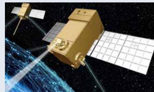
Një imazh imagjinari i një prej satelitëve të parë të shtresës së transportit të Agjencisë së Zhvillimit të Hapësirës. (Lockheed Martin)

Sateliti i tretë, një mjet inteligjence taktike, vëzhgimi dhe zbulimi, do të nisë veçmas për të demonstruar aftësitë e sensorit ISR dhe komunikimit. I quajtur “TacSat”, ai do të presë një sensor ISR të ndërtuar nga Lockheed, si dhe një ngarkesë 5G. Satelitët “Pony Express 2” do të fluturojnë në mjetin lëshues RS1 të “ABL Space Systems”. Kompania nënshkroi një marrëveshje me ABL në 2021 për të blerë deri në 26 raketa RS1 deri në vitin 2025 dhe deri në 32 deri në 2029 për të ngritur ngarkesat e zhvilluara nga Lockheed.