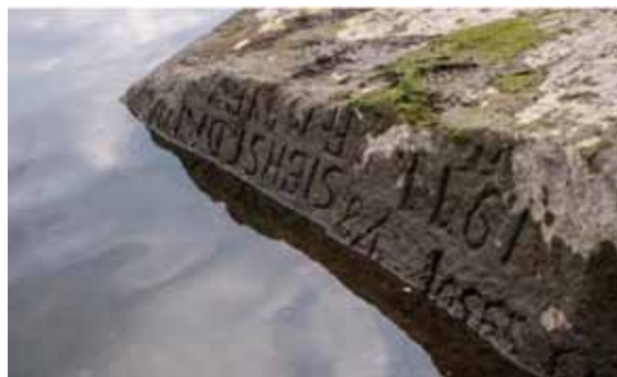
‘Guri i urisë’, një nga monumentet hidrologjike më të vjetra në Europën Qendrore, në Dëçin.

3000 njerëzve nga shtëpitë e tyre. Në Lombardi, themelet e ndërtesave prej druri që datojnë në epokën e bronzit janë ngritur nga shtrati i lumit Oglio, ndërsa kafka 100 000-vjeçare e një dreri dhe mbetjet e hienave, luanëve dhe rinocerontëve janë shfaqur në pjesët e thara të Liqeni i Komos.