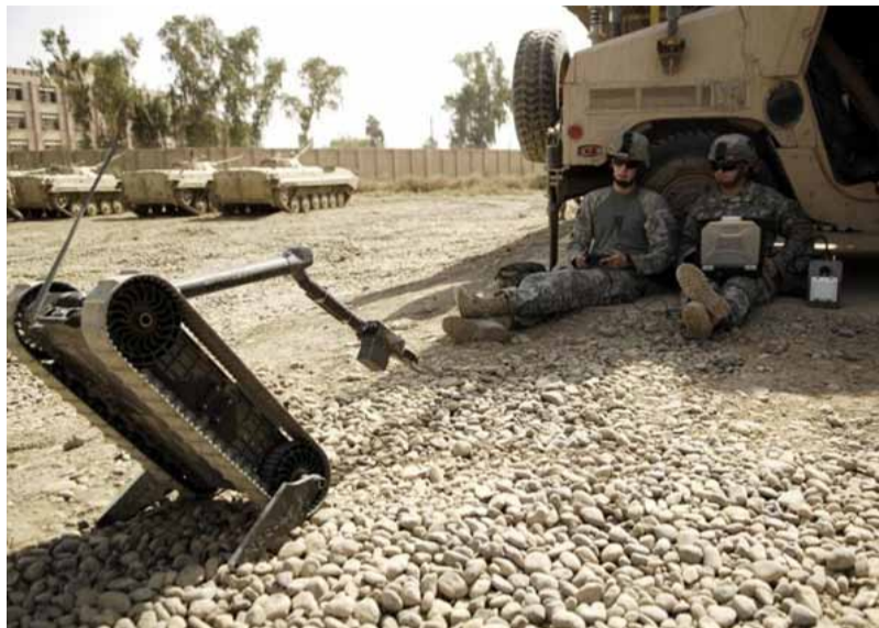
PackBot ishte një nga robotët e hershëm ushtarakë të përdorur gjërësisht.

Megjithatë, futja e AI në armët ushtarake nuk u pëlqen të gjithëve. Kjo ka nxitur krijimin e Komitetit Ndërkombëtar për Kontrollin e Armëve Robotike