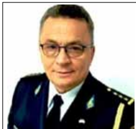
KOLONEL HYSNI GJERGJI

"Operacioni special" nuk është aspak i kufizuar, ai është drejtuar jo vetëm në një rajon të Ukrainës, jo vetëm në Ukrainë, madje jo vetëm në Europë.