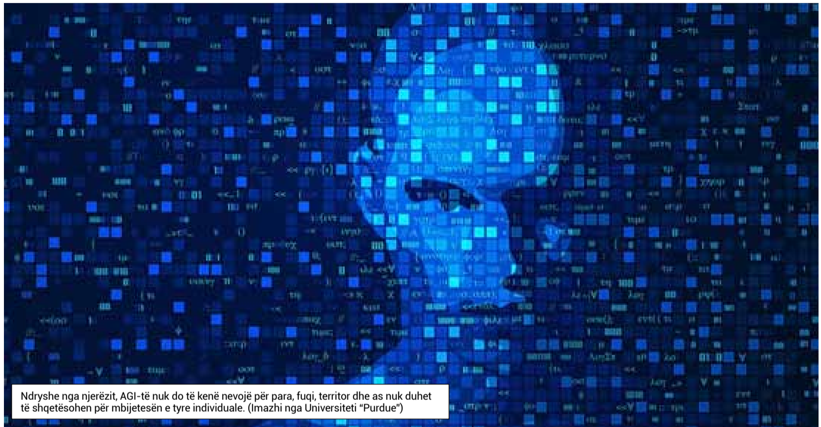
Ndryshe nga njerëzit, AGI-të nuk do të kenë nevojë për para, fuqi, territor dhe as nuk duhet të shqetësohen për mbijetesën e tyre individuale. (Imazhi nga Universiteti "Purdue")

Fillimisht, do të ketë shumë pak makina të vërteta "të të menduarit". Megjithatë, gradualisht, këto makina fillestare do të "piqen". Ashtu si drejtuesit e sotëm rrallë marrin vendime financiare pa u konsultuar