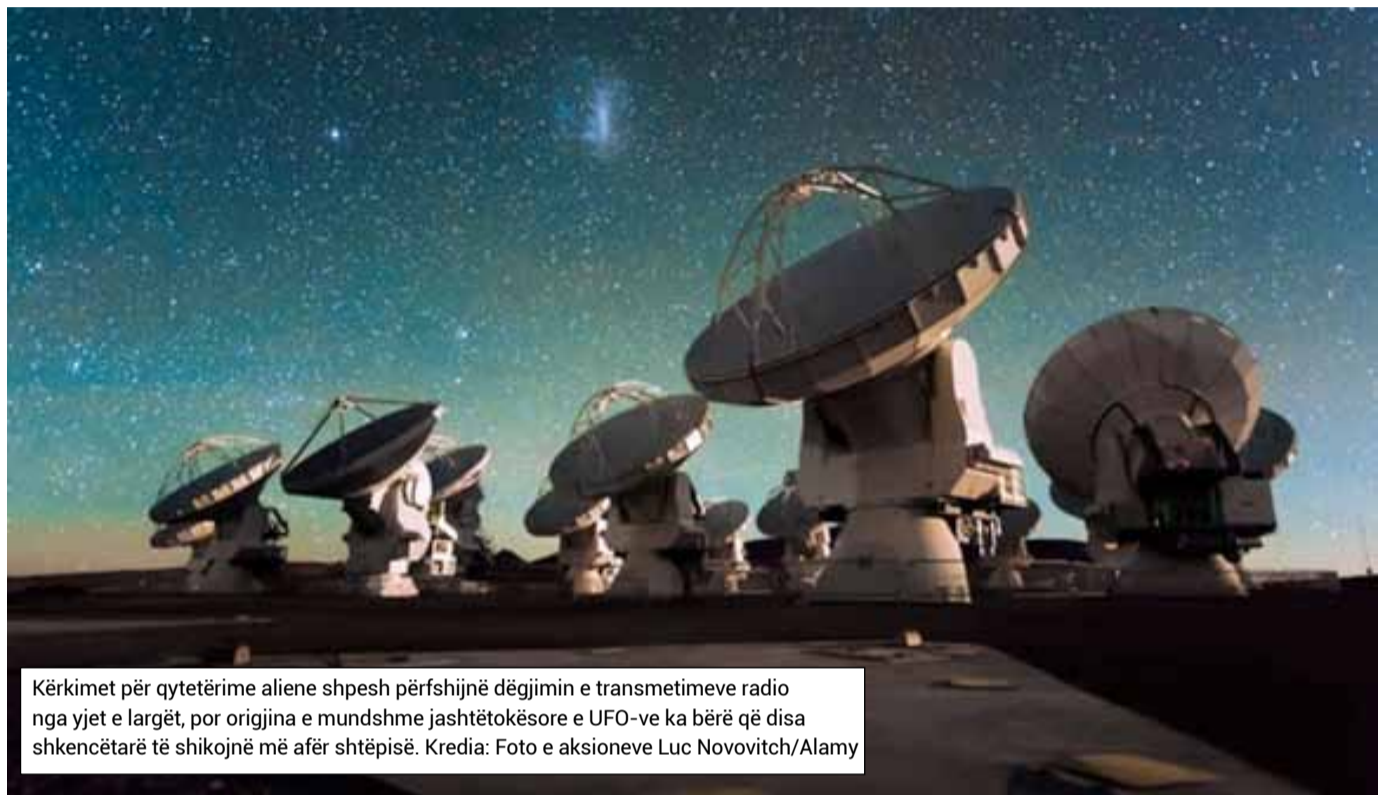
Kërkimet për qytetërimi aliene shpesh përfshijnë dëgjimin e transmetimeve radio nga yjet e largët, por origjina e mundshme jashtëtokësore e UFO-ve ka bërë që disa shkencëtarë të shikojnë më afër shtëpisë.

Duke qenë se ai është kreu i Projektit “Galileo”, i cili ka synime të mbivendosura, Loeb iu tha nga NASA se do të ishte një konflikt i interesit nëse ai merrte pjesë në përpjekjen e re të agjencisë. Ai