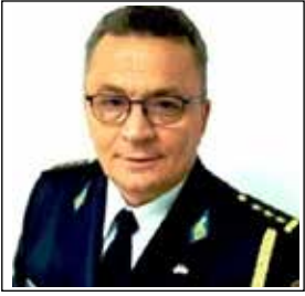
KOLONEL HYSNI GJERGJI