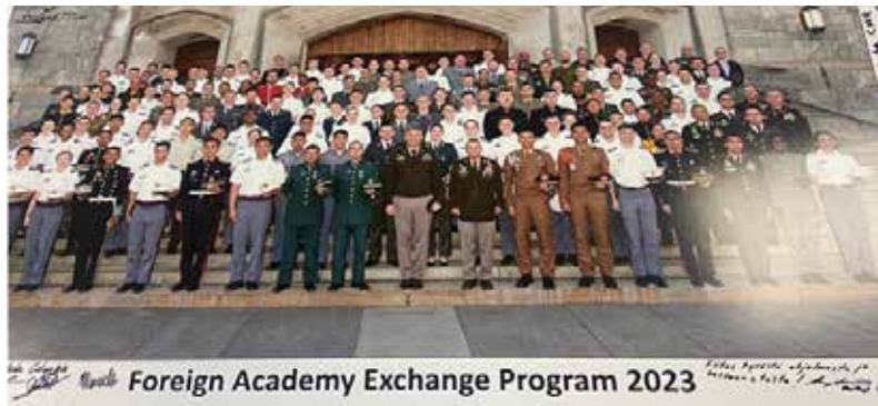
Foreign Academy Exchange Program 2023