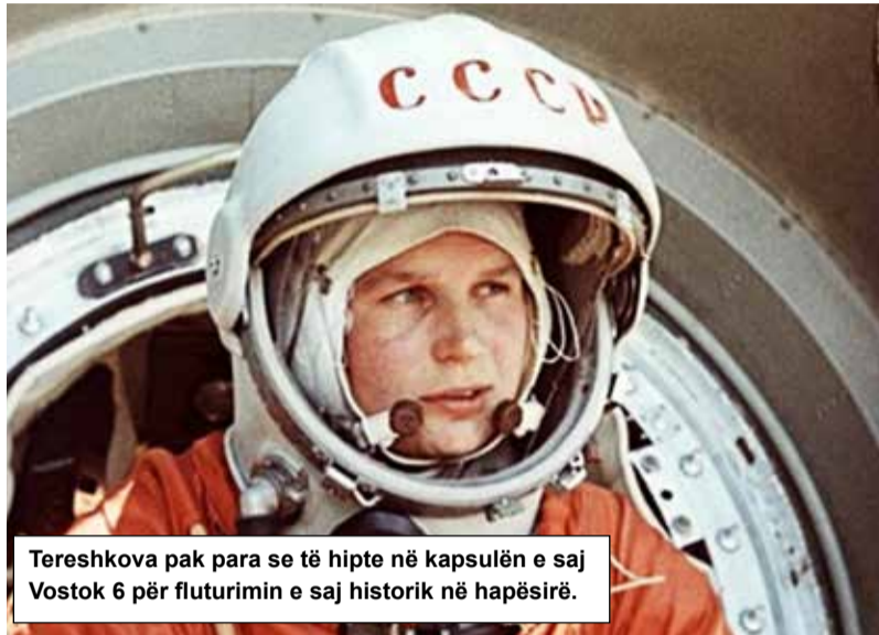
Tereshkova pak para se të hipte në kapsulën e saj Vostok 6 për fluturimin e saj historik në hapësirë.

E zgjedhur në klasën e astronautëve të NASA-s në vitin 1990, Ellen Ochoa u nis me grua e parë hispanike në hapësirë në prill 1993 si specialiste e misionit në fluturimin STS-56 të “Discovery”, misioni i dytë i Laboratorit Atmosferik