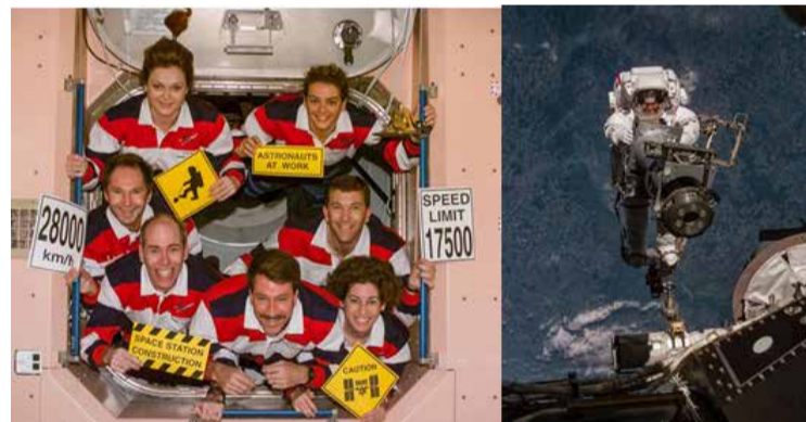
Majtas: Në 1999, ekipazhi STS-96 në modulën “Unity Node 1”, me astronauten e NASA-s Tamara E. Jernigan dhe Julie Payette të Agjencisë Kanadeze të Hapësirës në rreshtin e sipërm dhe astronauten e NASA-s Ellen Ochoa në fund djathtas. Mes: Jernigan gjatë ecjes hapësinore STS-96. Djathtas: Payette në modulën Unity Node 1.