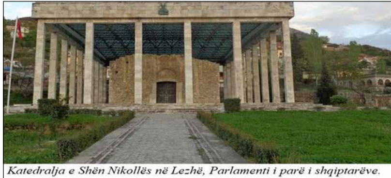
Katedralja e Shën Nikollës në Lezhë, Parlamenti i parë i shqiptarëve.

kryetarin e Lidhjes së Lezhës, Skënderbeun, vendosi që institucioni më i lartë të bëhej Kuvendi i Anëtarëve të Besëlidhjes, (Parlamenti i Shqiptarëve), i cili do të mbledhej herë pas here për çështje të rëndësishme të shtetit e të luftës. Kuvendi i princave shprehte bashkimin e shqiptarëve që u arrit në Lezhë. Një vendim tjetër shumë i rëndësishëm, që morën besëlidhësit e Lezhës, më 2 mars 1444, ishte krijimi i ushtrisë së përbashkët me komandant