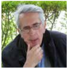
NGA SALI ONUZI