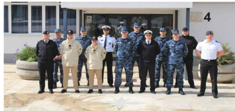
Kontributi i dhënë për sigurinë lundimore kombëtare dhe asaj të Aleancës është prioritet i Forcës Detare.