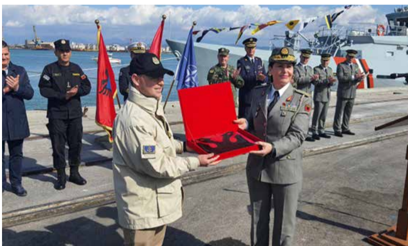
jen Kroate HRVS DUBROVNIK 42, kryen operacione për rritjen e sigurisë detare në Detin Mesdhe.