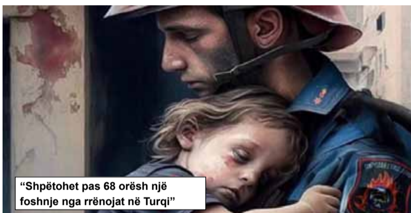
"Shpëtohet pas 68 orësh një foshnje nga rrënojat në Turqi"