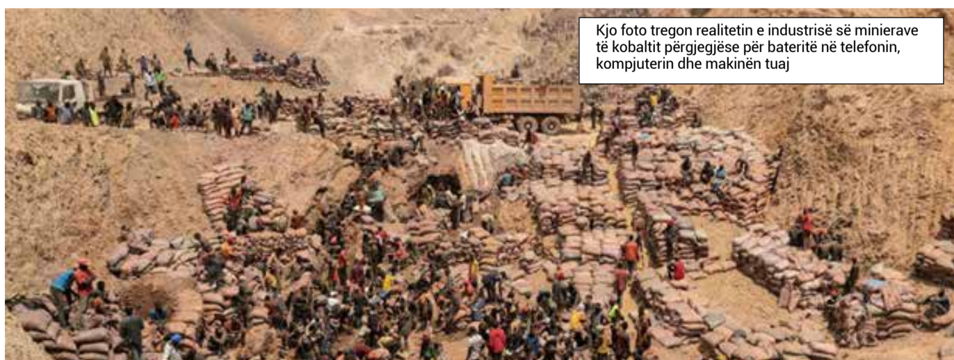
Kjo foto tregon realitetin e industrisë së minierave të kobaltit përgjegjëse për bateritë në telefonin, kompjuterin dhe makinën tuaj

Metodat e nxjerrjes së litiumit mund të çojnë në ndotje të ujit, degradim të tokës dhe ndotje të mundshme të ujërave nëntokësore, sipas “Earth.org”. Sipas Institutit të Qëndrueshmërisë MSCI, rreth 79% e rezervave të litiumit në SHBA janë brenda 35 milje nga rezervat vendase të Amerikës.