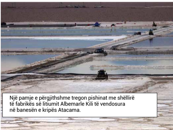
Një pamje e përgjithshme tregon pishinat me shëllirë të fabrikës së litiumit Albemarle Kili të vendosura në banesën e kripës Atacama.

Kjo do të thotë disa gjëra: McDermitt Caldera, e vendosur përgjatë kufirit Nevada-Oregon, mund të përmbajë mbi 132 milionë tonë litium - mjaftueshëm për të përmbushur kërkesën globale për