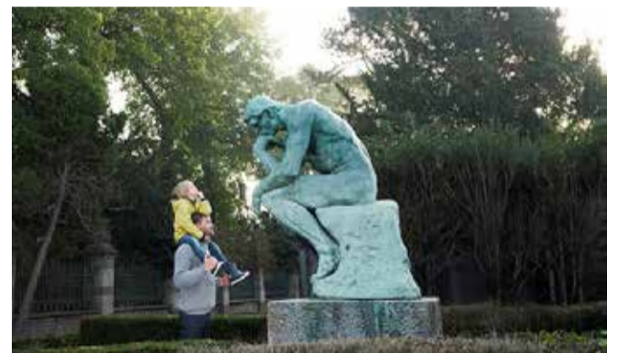
Ditët Evropiane të Trashëgimisë do të organizohen përgjatë kësaj periudhe, me një larmi aktiviteteve të shtrira në qytete të ndryshme të Shqipërisë.