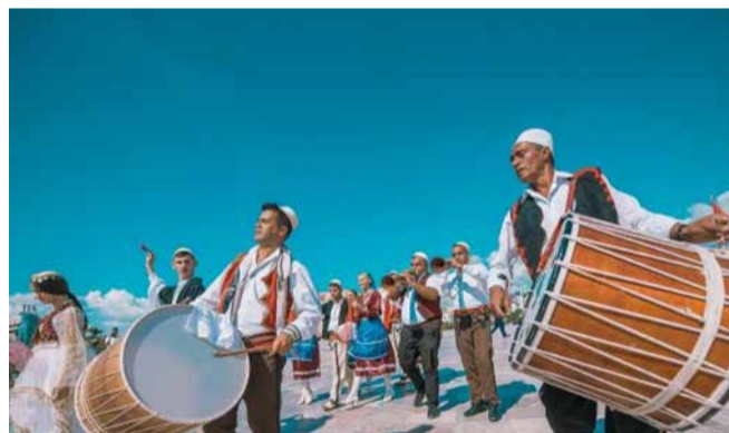
Zëvendës-President për Promovimin e "Mënyrës sonë Evropiane të Jetës". Sigurisht një nga vendet pjesëmarrëse nuk mund të mos ishte edhe Shqipëria. Me temën "Trashëgimia e qëndrueshme",