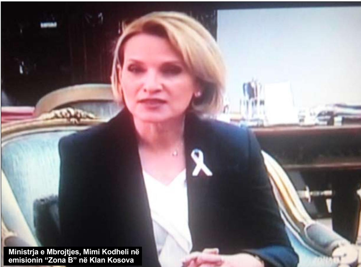
Ministrja e Mbrojtjes, Mimi Kodheli në emisionin “Zona B” në Klan Kosova

Unë besoj që njerëzit janë surprizuar sepse ndoshta është një perceptim që nga jashtë që unë jam një grua e fortë, që di të marr vendime. Ndërkohë që shpresoj shumë që pas një viti pune unë e kam kuptuar qofshin këta gjeneralë ose jo, ushtarakë ose jo që jam një bashkëpunëto e mirë dhe nuk rri tek e imja,