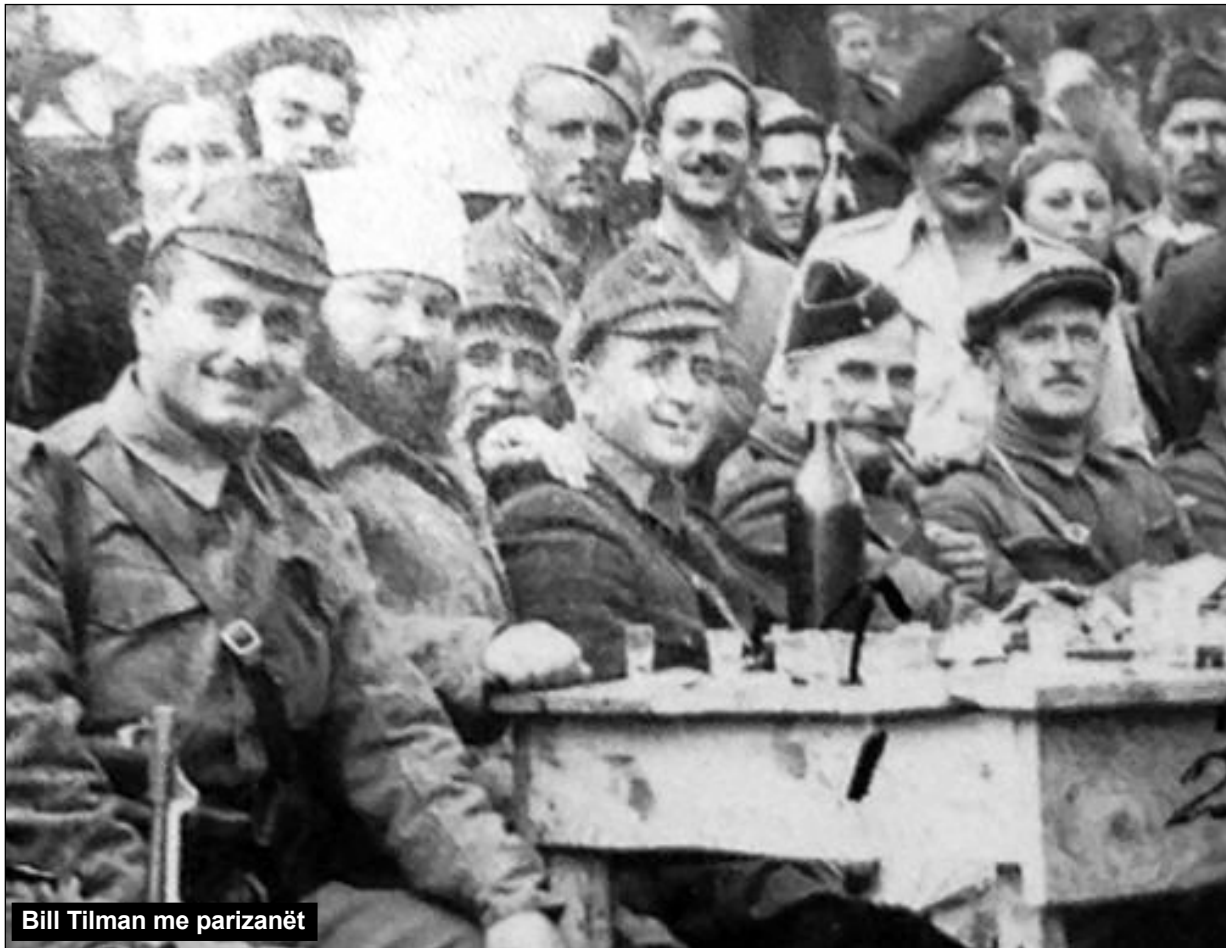
Bill Tilman me parizanët

Refleksione me rastin e 70 vjetorit të përfundimit të Luftës së Dytë Botërore