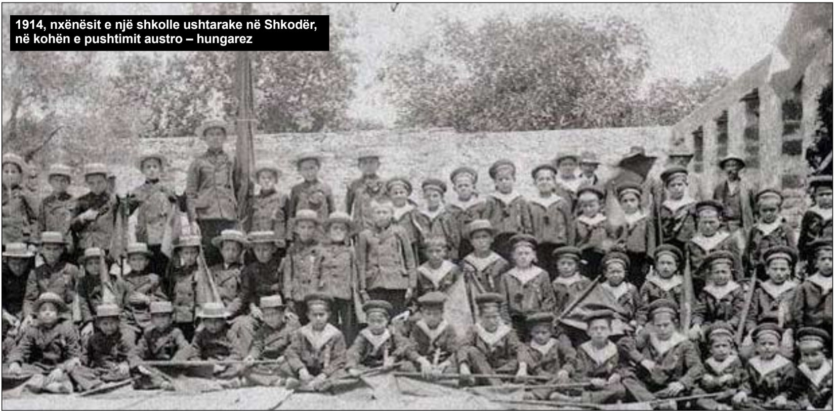
1914, nxënësit e një shkolle ushtarake në Shkodër, në kohën e pushtimit austro – hungarez

kur shprehet se: “...lera e një modeli është zakonisht në proporcion të drejtë me faktin se sa mirë korrespondon me të shkuarën, të tashmen, të ardhmen, nivelin aktual apo potencial të mundësive dhe perspektivës...” dhe më tej ndoshta e përbashkët në njohjen dhe analizën e modeleve se “Modeli i arsimit nuk qëndron më tepër në reformimin e studentëve, në zellin e tyre apo për tu bërë ekspert të teknologjisë. Arsimi qëndron në turbullimin e mendjes, zgjerimin e horizonteve, ndezjen e intelektit, të mësuarit për të menduar drejt, sa më tepër që të jetë e mundur...”