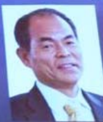
Shuji Nakamura University of California, Santa Barbara, CA, USA