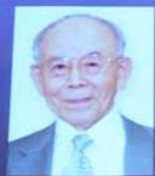
Isamu Akasaki Meijo University, Nagoya, Japan Nagoya University, Japan