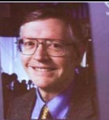
William E. Moerner Stanford University, Stanford, CA, USA