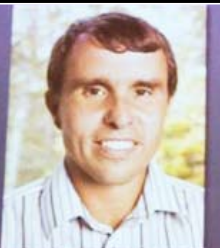
Eric Betzig Janelia Farm Research Campus, Howard Hughes Medical Institute, Ashburn, VA, USA