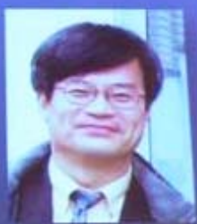
Hiroshi Amano Nagoya University, Japan