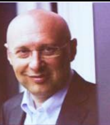
Stefan W. Hell Max Planck Institute for Biophysical Chemistry, Göttingen, German Cancer Research Center.