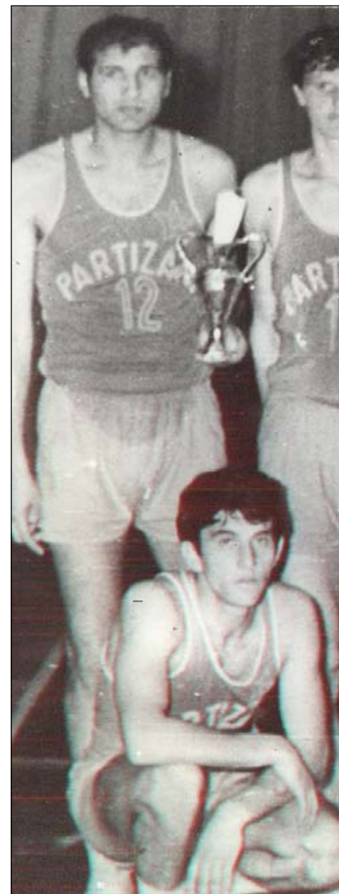
FIGURA TE SHQUARA

Një ekip shembull, me një frymë miqësore të jashtëzakonshme, me kulturë, me një edukatë shumë të lartë, me