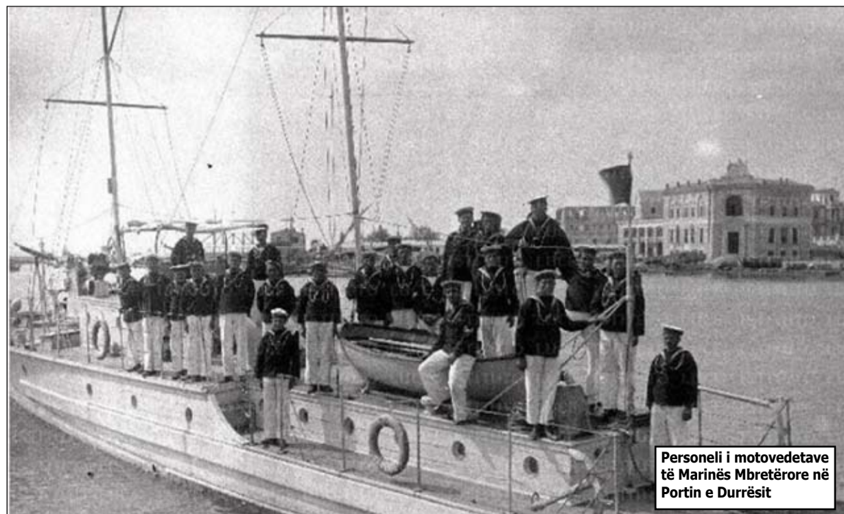
Personeli i motovedetave të Marinës Mbretërore në Portin e Durrësit

Ardhur në Itali në vitin 1917 dhe armatosur si pjesë e një pakete prej 24 mjeteve. Në vitin 1926 katër prej tyre u transferuan në Shqipëri. Në SHBA u prodhuan si një motovedetë për lëshimin e silurave, por në Shqipëri nuk ishte e pajisur me silura. Shërbyen në Marinën Mbretërore deri në vitin 1939 kur u kapën nga italianët, por asnjëherë nuk u përfshinë në inventarin e Marinës Mbretërore Italiane. Mbas kapitullimit të Italisë u kapën nga gjermanët. Tre nga katër motovedetat mbijetuan gjatë luftës dhe në vitin 1945 u kthyen në shërbim të Shqipërisë, të cilat morën numrat e bordit MS-10, MS-11 dhe MS-12.