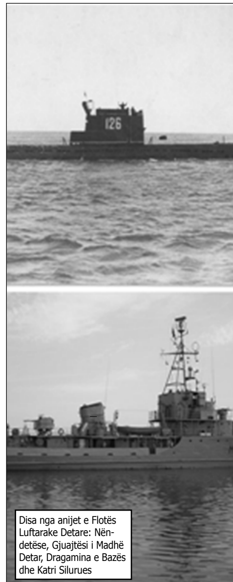
Disa nga anijet e Flotës Luftarake Detare: Nën- detëse, Gjuajtësi i Madhë Detar, Dragamina e Bazës dhe Katri Silurues