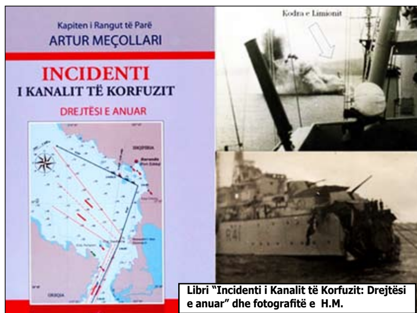
Libri “Incidenti i Kanalit të Korfuzit: Drejtësi e anuar” dhe fotografite e H.M.

gjithë Shqipërinë dhe forcat tona të Armatosura. Anijet e Flotës Detare pësuan dëmtime shumë serioze, por sidomos infrastruktura në tokë, por më pas personeli i kësaj Force punoi me shumë përkushtim dhe në pak vite flota u ringrit. Kjo falë edhe ndihmës së pakursyer të partnerëve tanë SHBA-së, Italisë, Turqisë etj. Në mjedisin e ri të sigurisë kombëtare të krijuar, Forca Detare në vitin 2002 mori edhe misionin e Rojes Bregdetare. Kjo i dha Forcës Detare një fizionomi të re si instrument i ushtrimit të sovranitetit dhe mbështetjes së interesave kombëtare. Mbas viteve 2007 Forca Detare hyri në një proces modernizimi nëpërmjet ndërtimit të një sistemi të vëzhgimit detar modern, prodhimin e katër anijeve të klasit “Iliria”, ndërtimit dhe funksionimit të QNOD-së dhe mbi të gjitha edukimit të një brezi oficerësh dhe detarësh profesionist, të devotshëm dhe përkushtuar. Mjedis i pritshëm i sigurisë kombëtare, por edhe ai rajonal detar kërkon një vizion të ri për Forcat tona Detare: projektimin e kapaciteteve të mjaftueshme për të përballur kërcënimet e së ardhmes ndaj interesave kombëtare detare në zgjerim.