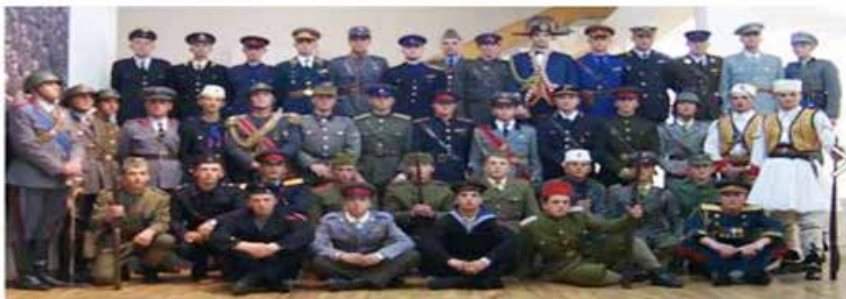
Nga ekspozita e vitit 2002, “Shteti shqiptar në uniforma”, çelur pranë Galerisë së Arteve në Tiranë