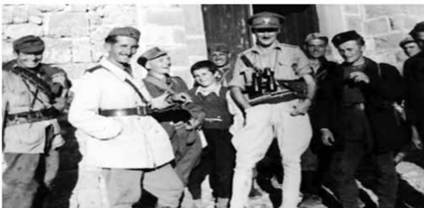
Anëtarë të misioneve britanike në vitet 1943-44 dhe krerë nacionalistë shqiptarë