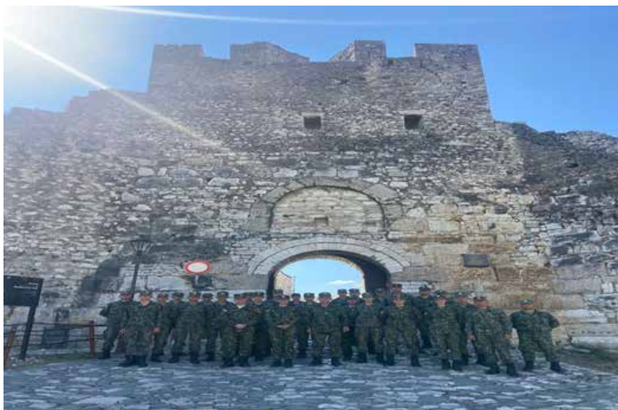
Vizitë mësimore në Berat (13.09.2021)