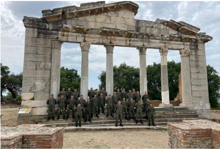
Apoloni, Fier (1709.2021)

fusha të ndryshme, ne menduam të realizonim "Programin Ekstra-Kurrikular". Si pjesë e programit u menduan aktivitete të ndryshme si kursi i alpinizmit për të rritur aftësitë e tyre fizike në ngjitjet dhe zbritjet malore gjithashtu dhe stërvitja ujore në Bazën Detare të Pashalimanit."