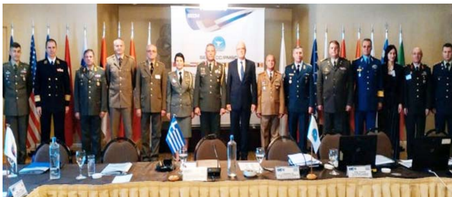
TAKIMI I SEDM-IT NË ATHINË