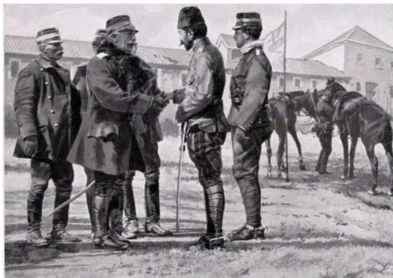
THE SURRENDER OF YANINA, 1913.