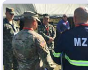
STËRVITJA “JOINT REACTION 19”

Në këtë stërvitje morën pjesë Shqipëria, Bosnje dhe Hercegovina, Kosova, Mali i Zi, Shtetet e Bashkuara të Amerikës (US-EUCOM) dhe NATO, EADRCC, Garda e New Jersey-it dhe Kryqi i Kuq shqiptar. Qëllimi i kësaj stërvitjeje është që të forcojë bashkëpunimin dhe ndërveprimin midis partnerëve rajonal të Gadishullit Ballkanik, në lidhje me mbështetjen, vendosjen dhe aktivizimin në kohë dhe në mënyrë efektive të aseteve dhe kapaciteteve reaguese për përballimin e fatkeqësive në rastet e përballjes me emergjencat civile, duke siguruar një qasje gjithëpërfshirëse rajonale.