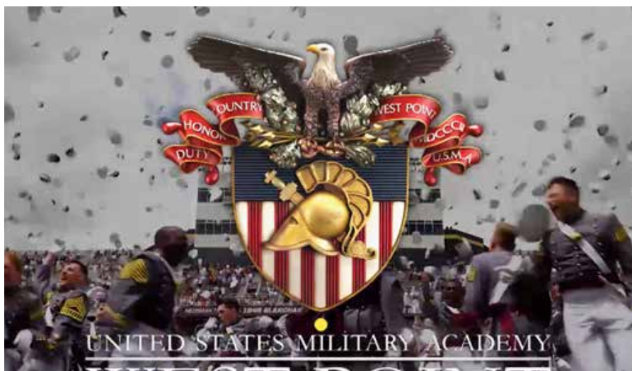
Akademia Ushtarake West Point dhe Akademia e Forcave Ajrore në SHBA

Kandidati/tja që aplikon për pranim në Akademitë në SHBA duhet të: Jetë shtetas i Republikës së Kosovës; ketë zotësi të plotë për të vepruar; ketë kryer shkollën e mesme, përfshirë dhe testin kombëtar të maturës; mos jetë i/e dënuar apo i/e ndjekur penalisht nga organet e drejtësisë; jetë i moshës 18 vjeç dhe jo më shumë se 22 vjeç, në ditën e fillimit të vitit akademik (1 korrik 2021); ketë një trup me fizik të rregullt, të shëndetshëm nga të gjitha pikëpamjet, pa asnjë mangësi apo shenja që deformojnë pamjen; mos ketë tatuazhe në fytyrë, qafë dhe parakrah nga pjesa e bicepsit e deri te gishtat e dorës duke përfshirë edhe pirsing; ketë notën mesatare gjatë shkollimit të mesëm të lartë "shumë mirë e lartë"; ketë njohuri të mira me