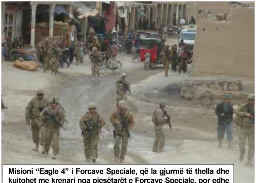
Misioni “Eagle 4” i Forcave Speciale, që la gjurmë të thella dhe kujtohet me krenari nga pjesëtarët e Forcave Speciale, por edhe nga përfaqësues të lartë të shtetit dhe ushtarakë të lartë Amerikanë.