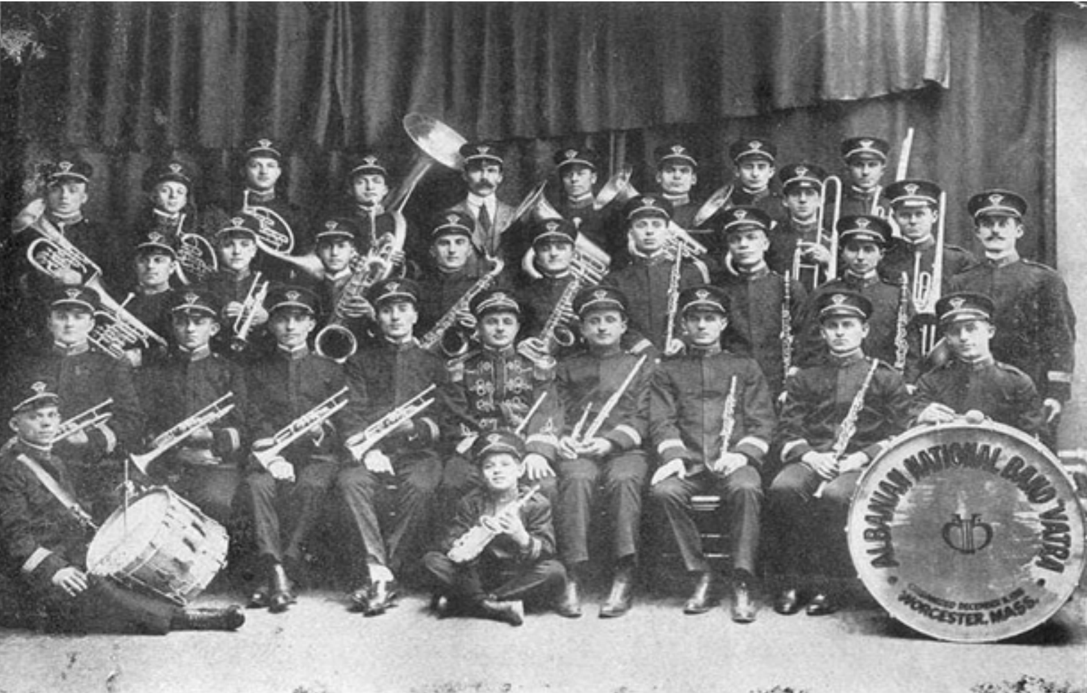
Banda Kombëtare "Vatra" e krijuar në Worcester, Mass. USA