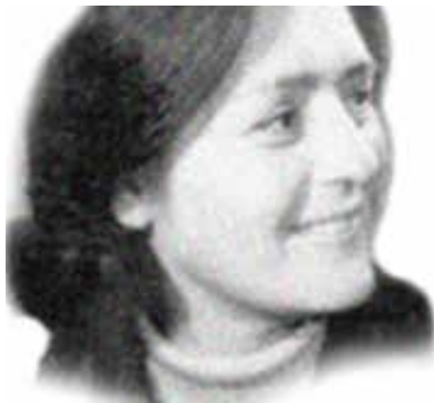
Xhanfise Keko , 1928-2007, ishte regjisorja e parë shqiptare dhe një ndër themelueset e studios së filmit 'Shqipëria e Re'.