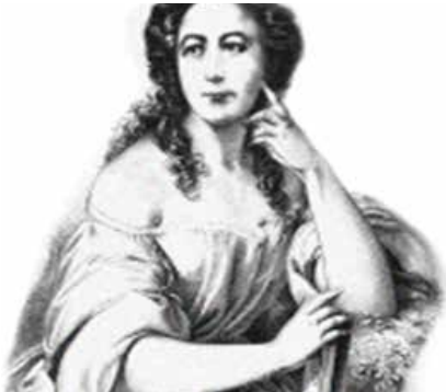
Dora D'Istria apo Elena Gjika , 1828-1888 ishte intelektuale dhe revolucionare shqiptare. Përpos spektrit intelektual ajo ndihmoi edhe në afirmimin e çështjes kombëtare sidomos në kontributin e madh që dha në Lidhjen Shqiptare të Prizrenit.