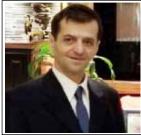
KAPITEN (P) VERI TALUSHLLARI