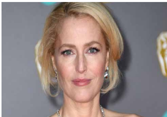
Gillian Anderson, aktore dhe aktiviste

“Ne nuk mund të kemi sukses, kur gjysma prej nesh pengohen të ecin përpara.”