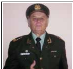
“Mjeshtër Kërkimesh”, kolonel Myslim Pasha, ish-drejtori i Institutit të Topografisë Ushtarake