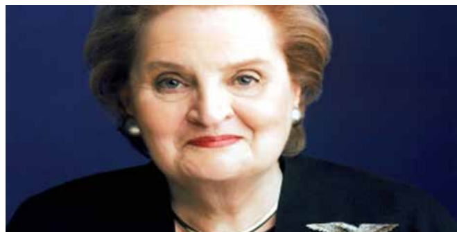
Madeleine Albright, politikane

“Kur një burrë jep mendimin e tij ai është një zotëri. Kur një grua jep mendimin e saj, për fat të keq shpesh quhet e përdalë.”