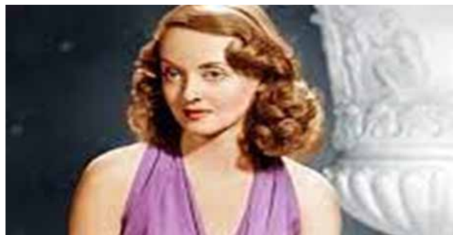
Bette Davis, aktore

“Ne të gjithë luftojmë mbi atë që ka etiketën 'feminizëm', por për mua ka të bëjë me fuqizimin. Nuk ka të bëjë me të qenit më të fuqishëm se burrat, ka të bëjë me të drejtat e barabarta në mbrojtjen, mbështetjen, drejtësinë. Bëhet fjalë për gjëra shumë themelore. Nuk është një simbol sikundër një artikull i modës”.