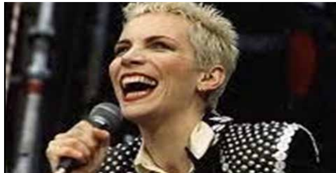
Annie Lennox, këngëtare dhe aktiviste politike

“Feminizmi nuk ka të bëjë me rritjen profesionale të grave, ato (gratë) janë tashmë të forta, por është ndryshimi i mënyrës se si bota e percepton këtë forcë.”