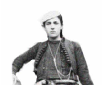
Shote Galica , 1895-1927, ishte Heroinë e Popullit dhe luftëtare e kryengritjeve kosovare për çlirimin dhe bashkimin kombëtar.