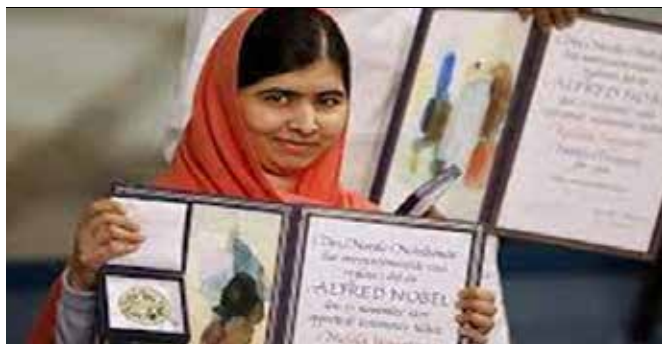
Malala Yousafzai, aktiviste dhe fituese e çmimit “Nobel”, 2014:

Disa prej mesazheve të grave që jeta i sfidoi në dimensione të ndryshme.