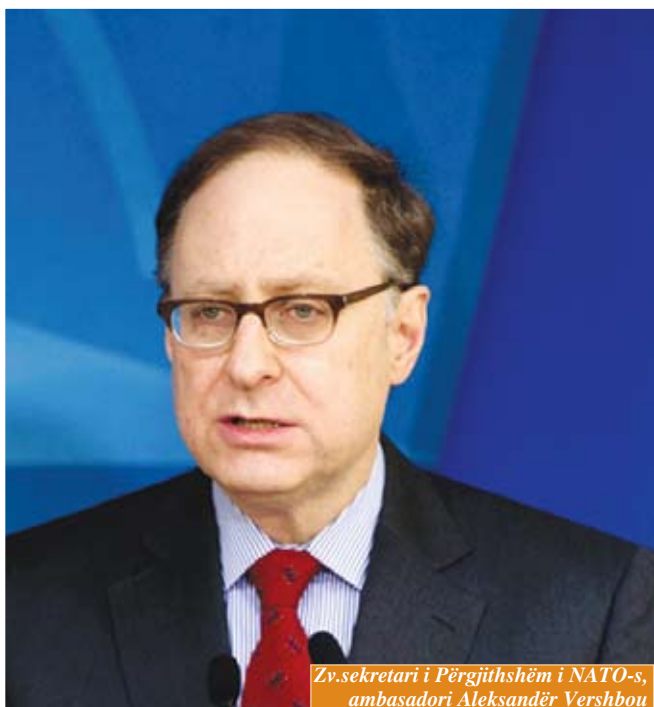
Zv.sekretari i Përgjithshëm i NATO-s, ambasadori Aleksandër Vershbow

Takimet tuaja sot dhe nesër ju ofrojnë mundësinë për të marrë në konsideratë se si kombet në Europën Juglindore mund të ndihmojnë për të arritur këtë vizion dhe të përçoni një mesazh të fuqishëm, se vendet e këtij rajoni kanë shumë për të kontribuar në sigurinë tonë të përbashkët. Siguria kërkon angazhimin tonë të përbashkët për të mbrojtur interesat tona, vlerat tona dhe popujt tanë. Kam sugjeruar disa ide në lidhje me mënyrat se si kombet mund të grupohen në një bashkëpunim rajonal për të përmirësuar sigurinë tonë. Pa dyshim, mund të ketë edhe mjaft ide të tjera dhe unë ju inkurajoj të shpalosni idetë tuaja. Duke e përfunduar me këtë, mbetem në pritje të diskutimeve tuaja sot.