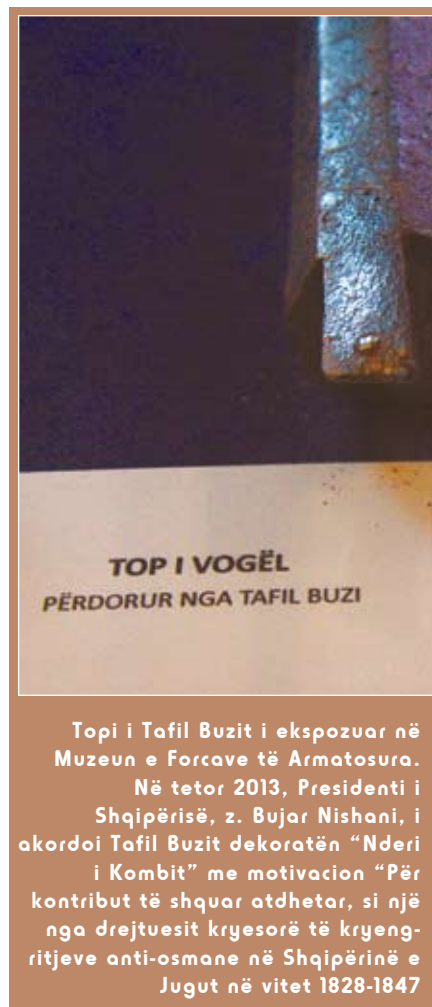
TOP I VOGËL PËRDORUR NGA TAFIL BUZI

Topi i Tafil Buzit i ekspozuar në Muzeun e Forcave të Armatosura. Në tetor 2013, Presidenti i Shqipërisë, z. Bujar Nishani, i akordoi Tafil Buzit dekoratën “Nderi i Kombit” me motivacion “Për kontribut të shquar atdhetar, si një nga drejtuesit kryesorë të kryengritjeve anti-osmane në Shqipërinë e Jugut në vitet 1828-1847