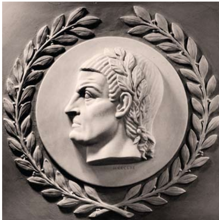
Perandori me originë ilire, Justiniani i Madh