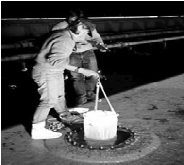
Fig 2. Procedura e Rojës Bregdetare për marrjen e kampionit nga ballasti i anijes

Marrja dhe trajtimi i ballasteve dhe mbeturinave që dorëzohen në sistemet e marrjes së tyre nëpër porte duhen të jenë në dispozicion të subjekteve që merren me trajtimin e mjedisit e të llumrave të cisternave.